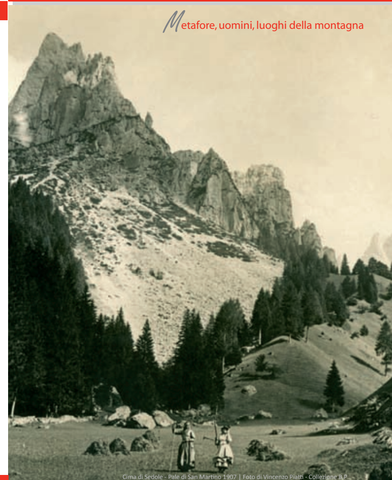
Cima di Sedole - Pale di San Martino 1907